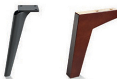
Carmen Brushed Black Chrome drewniana Carmen