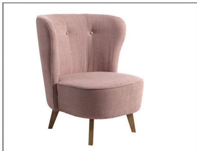
Carmen; wersja podstawowa; nóżki drewniane CARMEN

Fotel typu Carmen, to fotel-kameleon, można by rzec. Wszystko za sprawą tapicerki, która w zależności od barwy i struktury, zgrabnie dostosowuje się do charakteru otoczenia. Kształt fotela z kolei, odznaczający się miękką, łagodną w zagięciach linią, skutecznie zachęci do zatopienia się w nim i odpłynięcia w krainę błogiego relaksu.