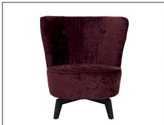
Carmen, wersja obrotowa