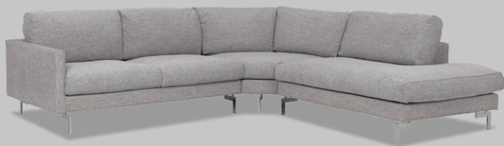
Blues DAY Carter 2,5L+Cmax+EP