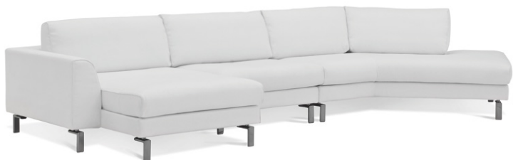
Blues DAY Baker CHI 90L+1,5+CEP R