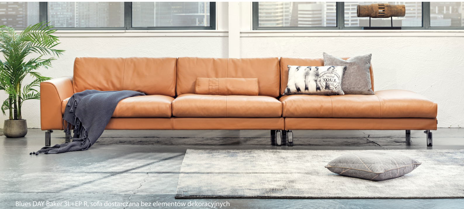
Blues DAY Baker 3L+EP R, sofa dostarczana bez elementów dekoracyjnych