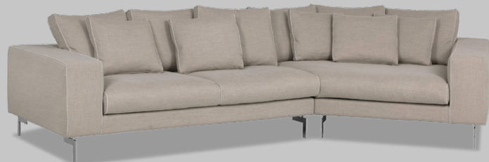
Blues NIGHT Memphis 2 L+MULTI R