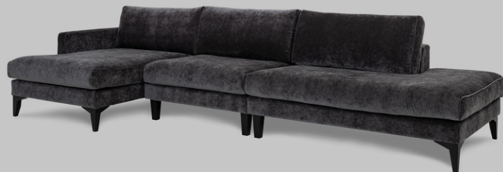
Blues DAY Carter CHL L+1,5+EP R