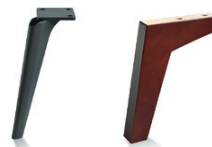
Carmen Brushed Black Chrome drewniana Carmen